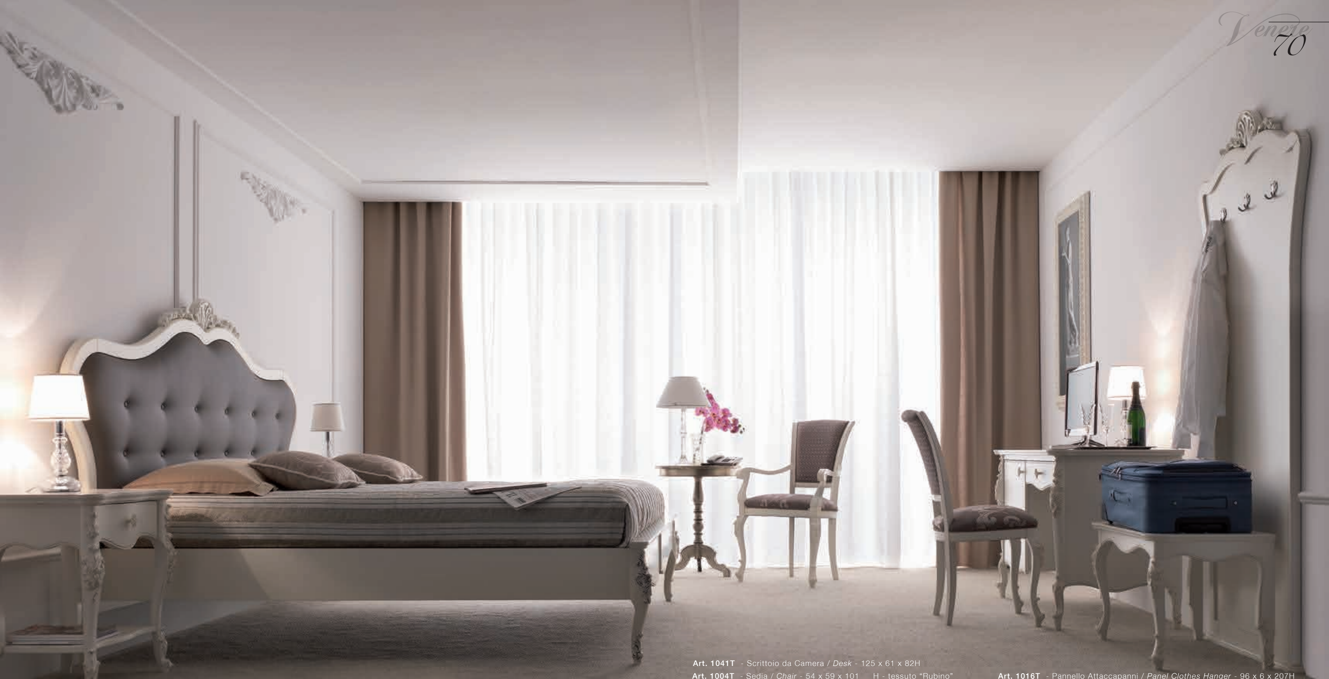
Art. 1033T - Comodino / Night Table - 57 x 40 x 68H