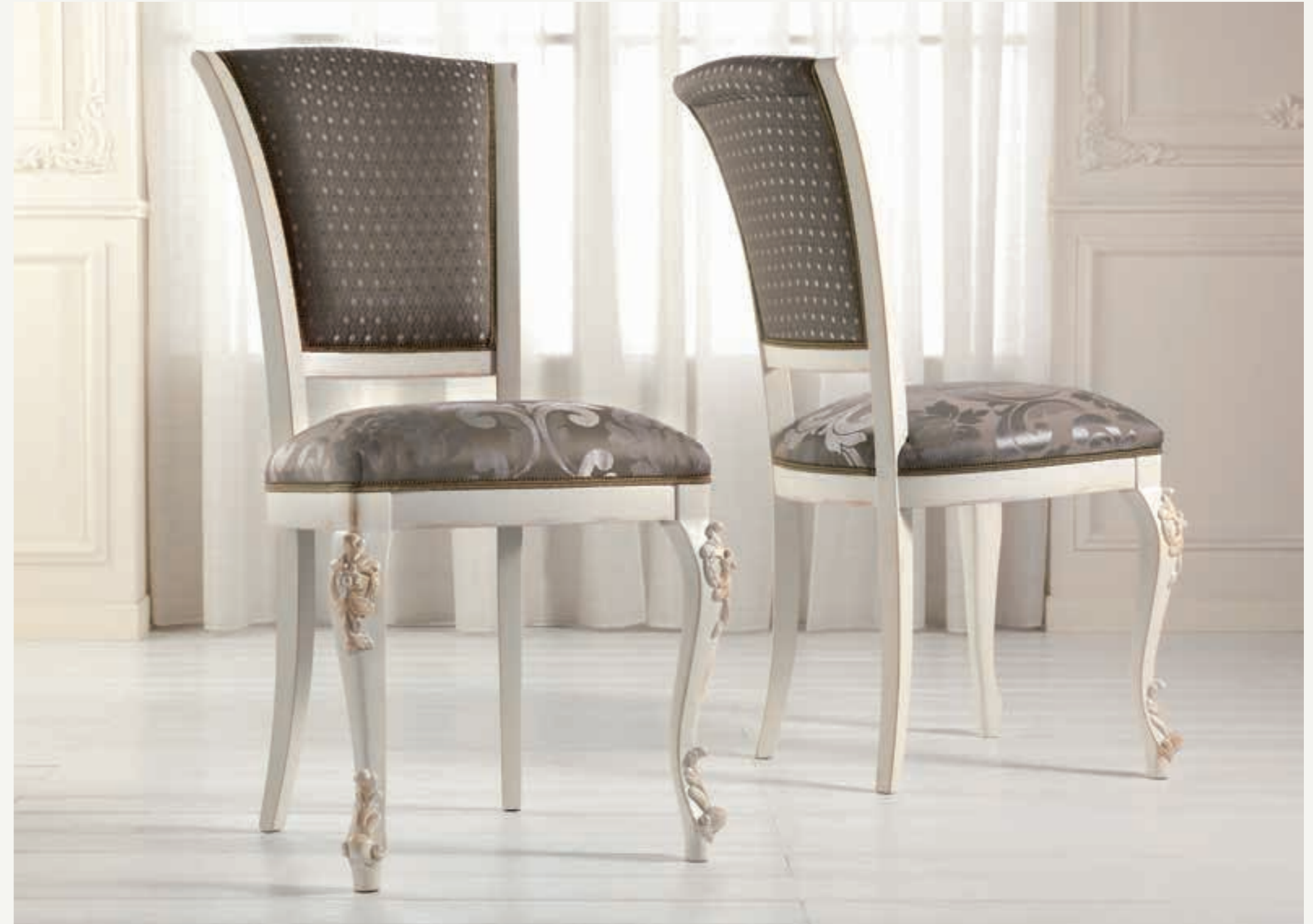
Art. 1004T - Sedia / Chair - 54 x 59 x 101H - tessuto / fabric "Rubino"