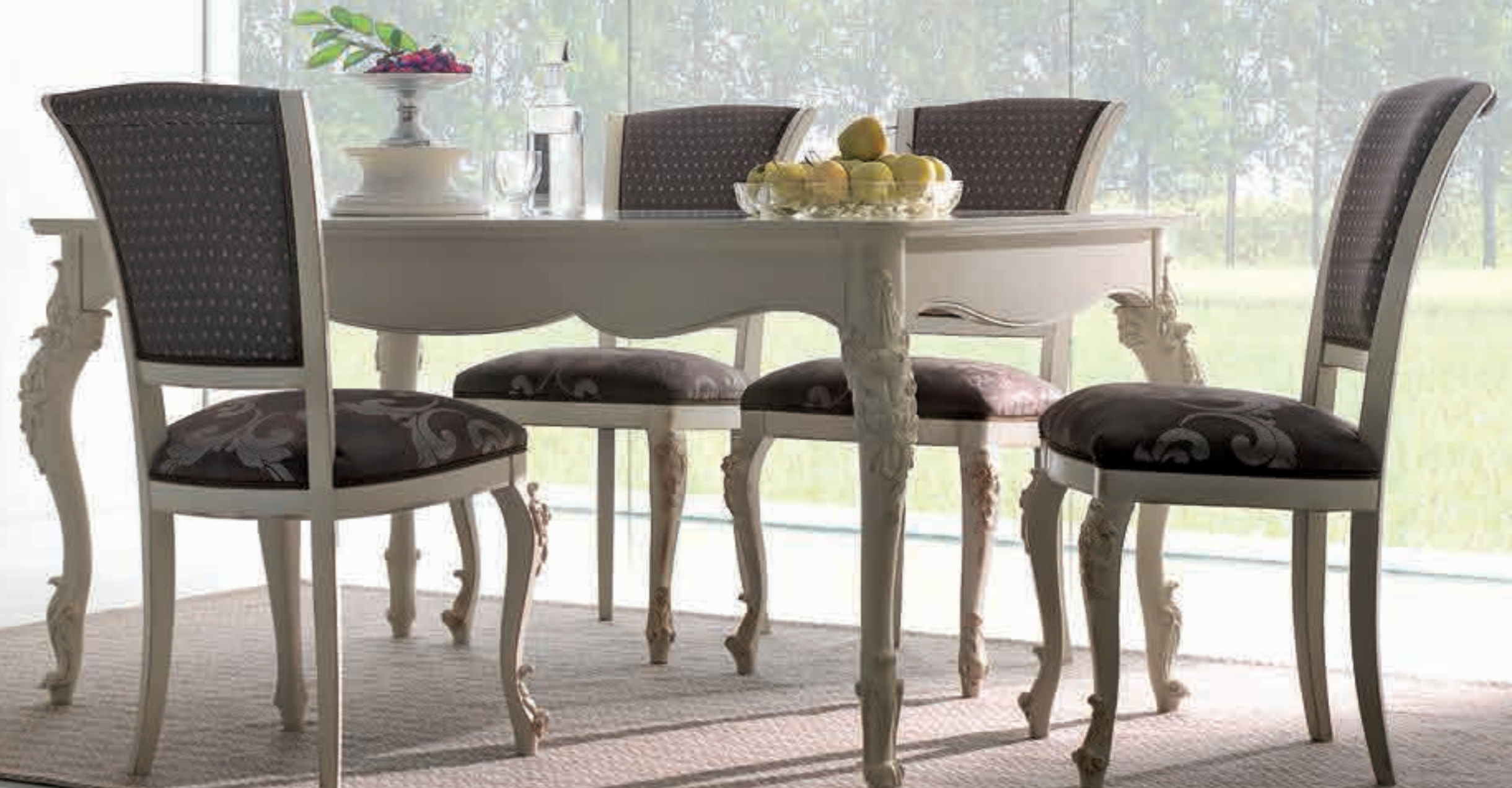
Art. 1007T - Tavolo due allunghe cm.39 / Table 2 extensions cm.39 - 161x101x81H