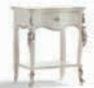
Art. 1033T Comodino Night Table 57 x 40 x 68H