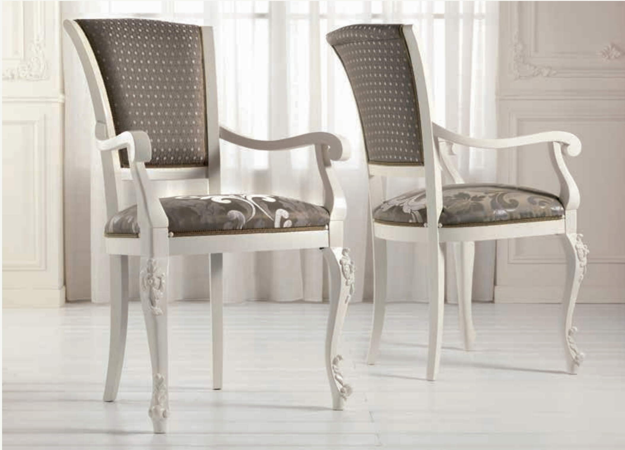
Art. 1005T - Sedia Capotavola / Armchair - 64 x 62 x 101H - tessuto / fabric "Rubino"