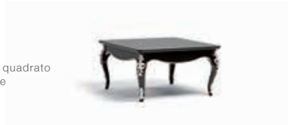
Art. 1013T Tavolino da salotto quadrato Square Coffee Table 90 x 90 x 48H