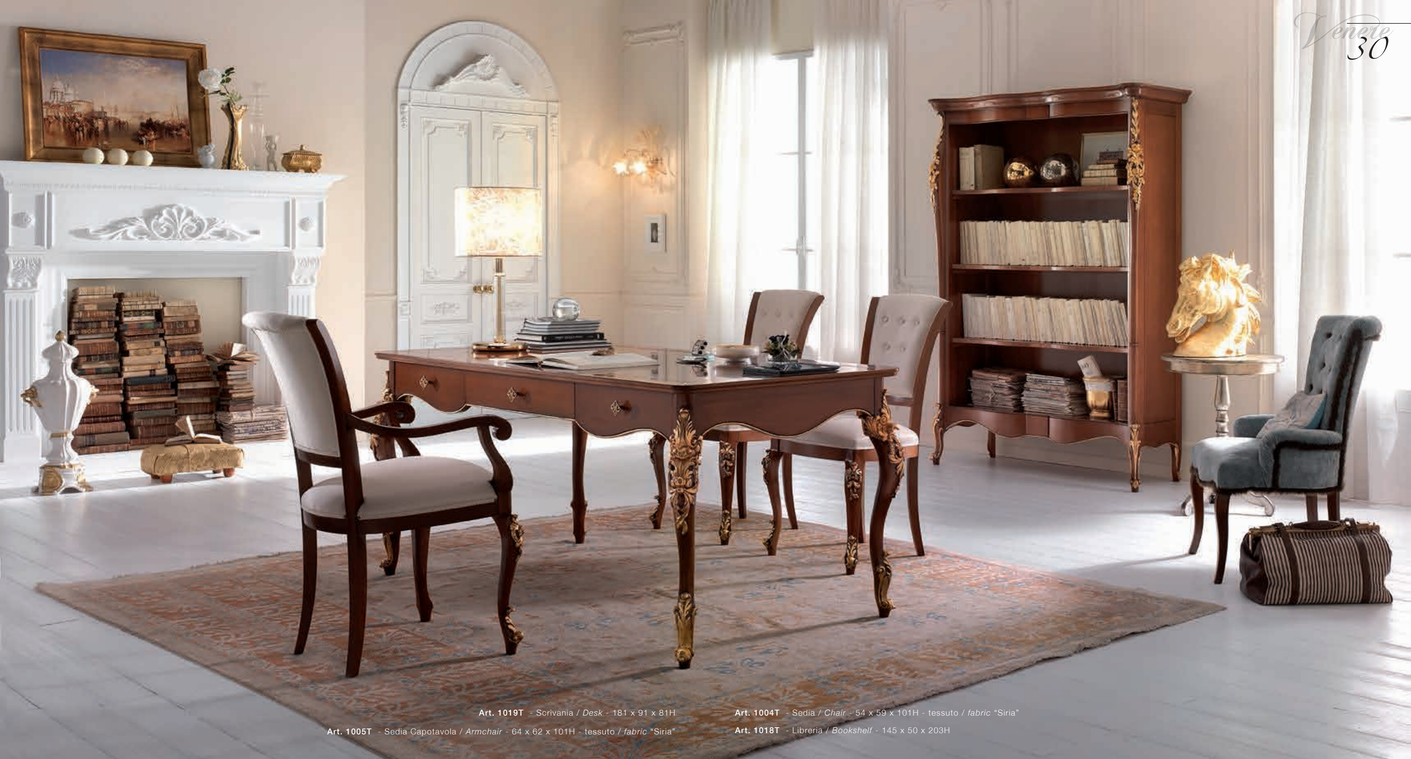
Art. 1019T - Scrivania / Desk - 181 x 91 x 81H