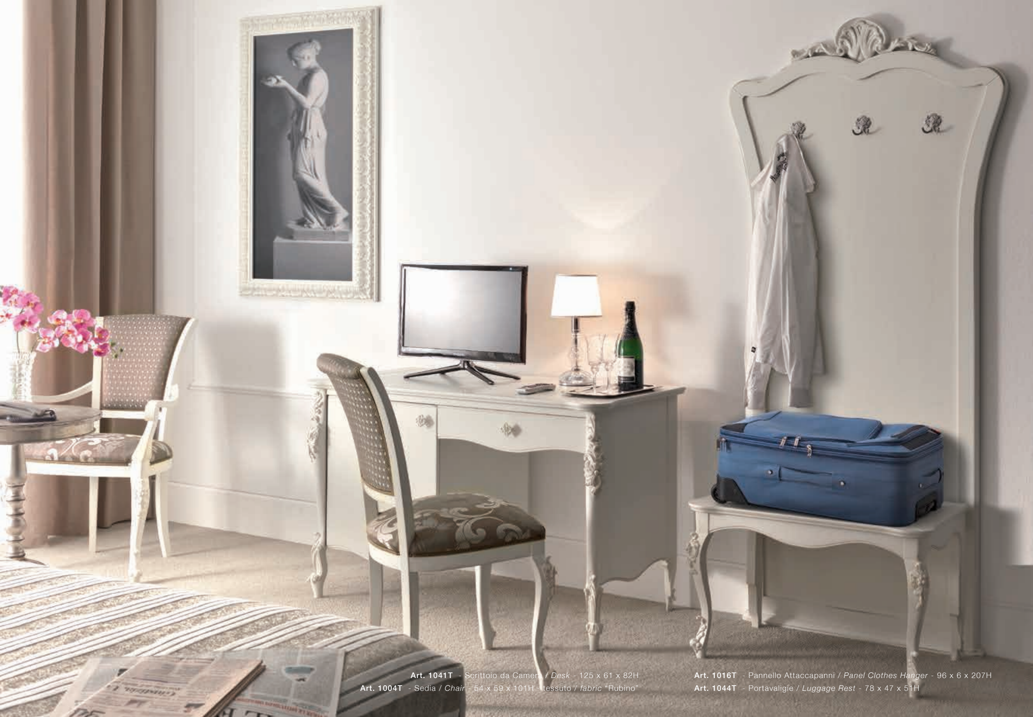
Art. 1041T - Scrivania da Camera / Desk - 125 x 61 x 82H Art. 1004T - Sedia / Chair - 54 x 59 x 101H - tessuto / fabric "Rubino"