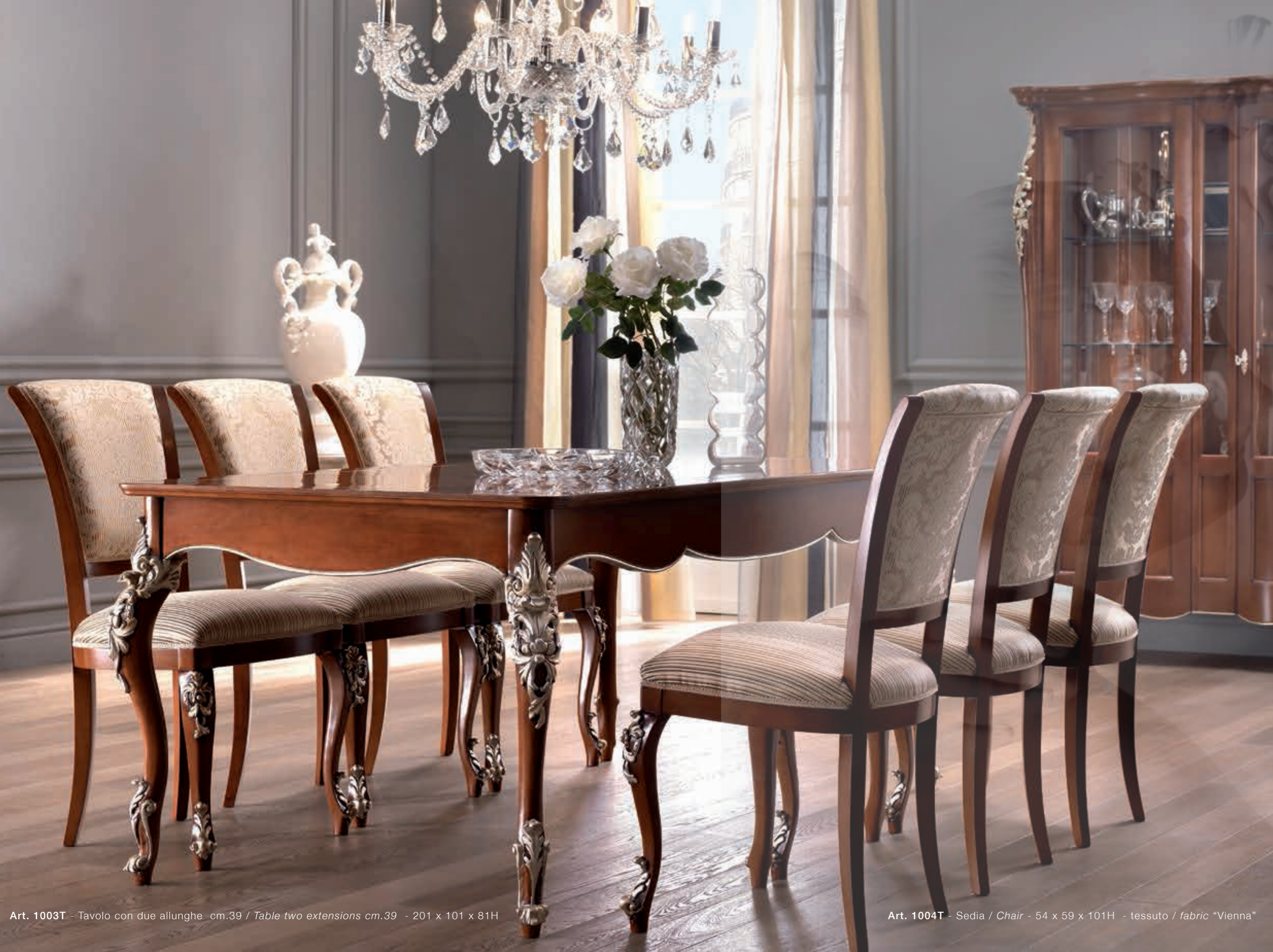
Art. 1003T - Tavolo con due allunghe cm.39 / Table two extensions cm.39 - 201 x 101 x 81H