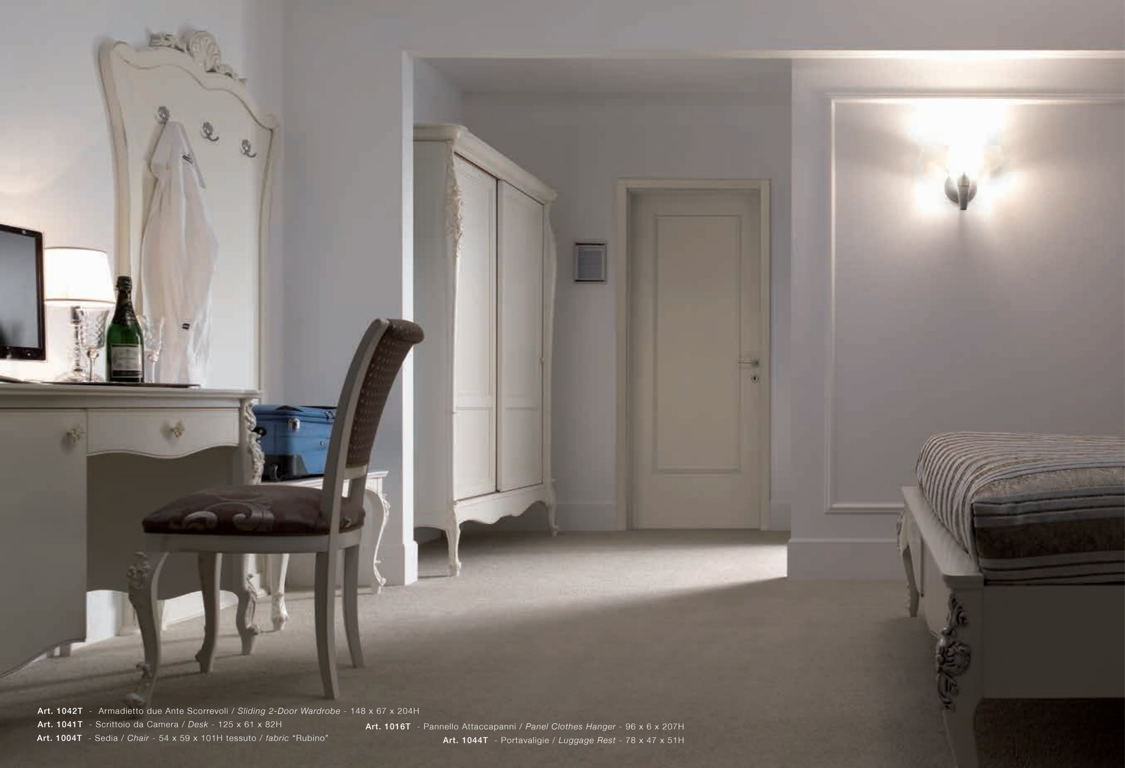
Art. 1042T - Armadietto due Ante Scorrevoli / Sliding 2-Door Wardrobe - 148 x 67 x 204H