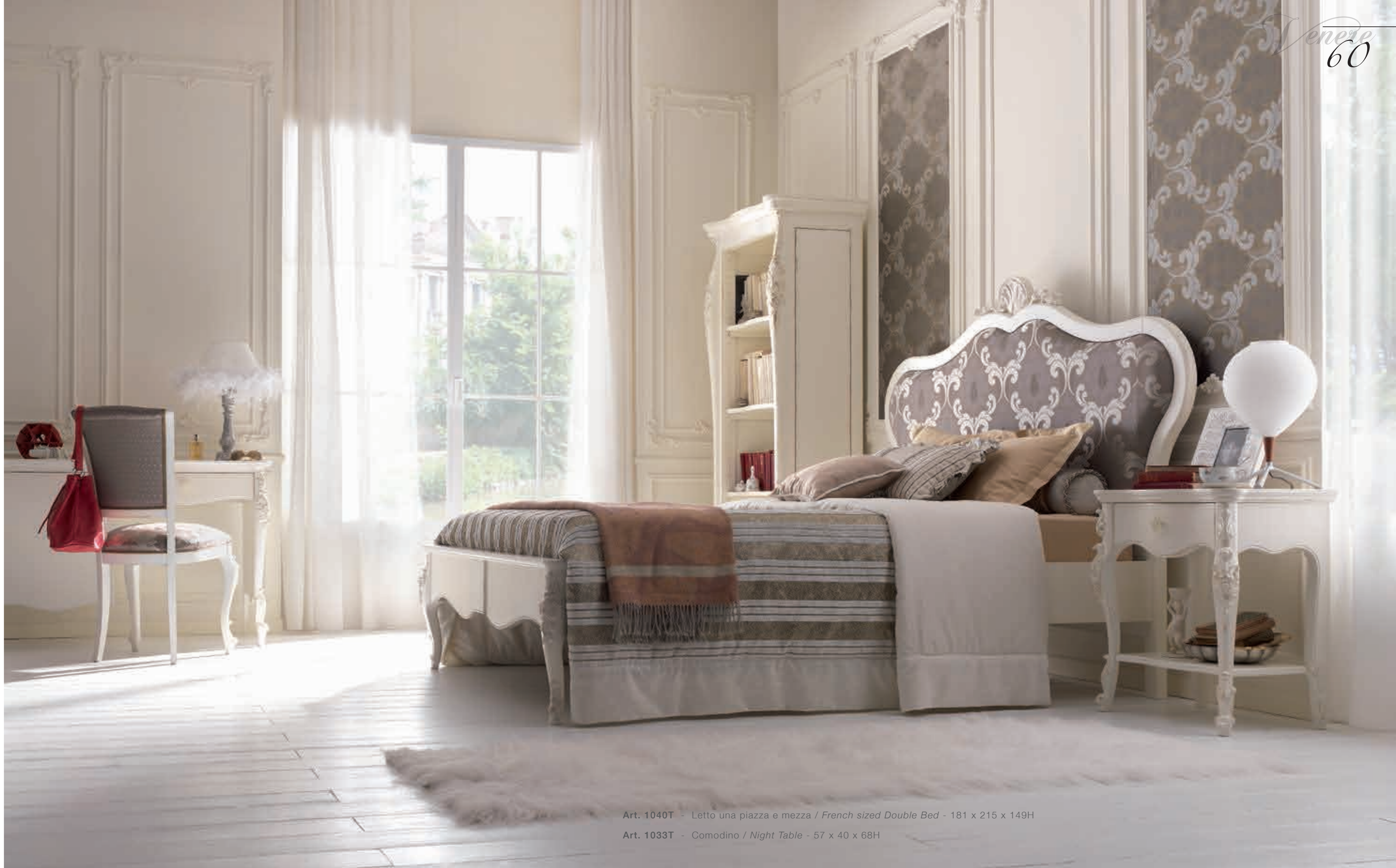
Art. 1040T - Letto una piazza e mezza / French sized Double Bed - 181 x 215 x 149H