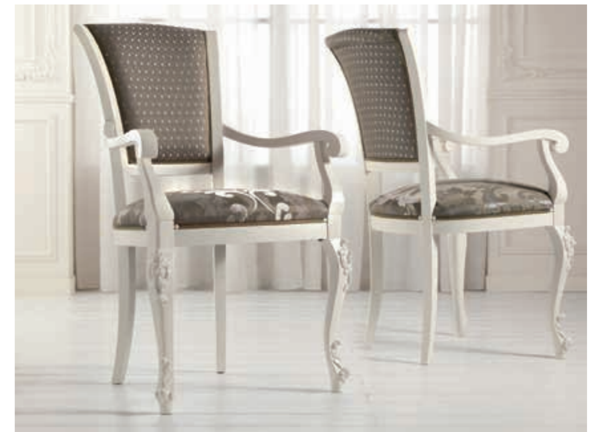
Art. 1005T - Sedia capotavola / Armchair - 64 x 62 x 101H - tessuto / fabric "Rubino"