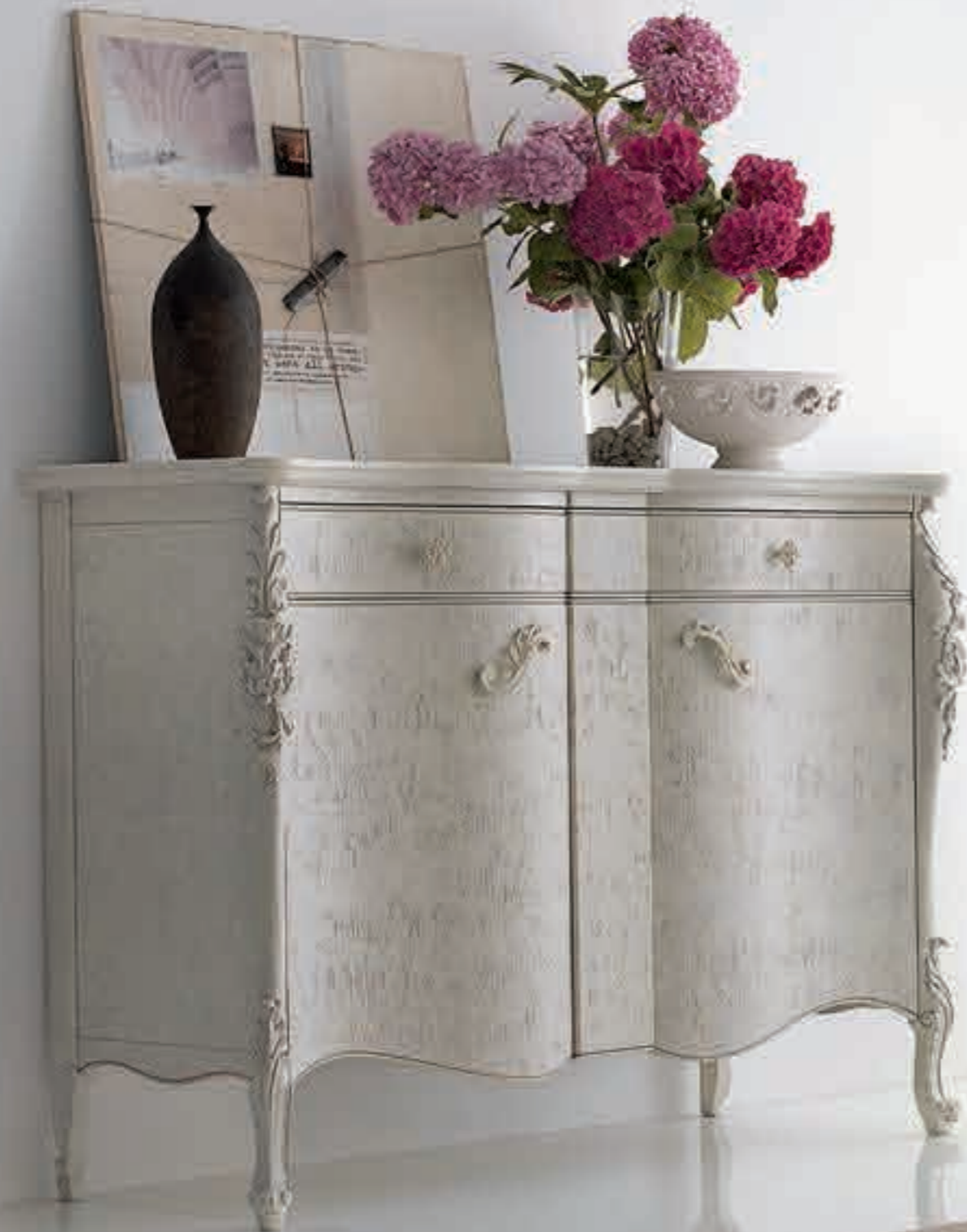
Art. 1006T - Credenzina / Sideboard - 137 x 57 x 110H

Attention to detail and research into new design solutions in the finishes allow these elements to live in inflexible and modern furnishing solutions.