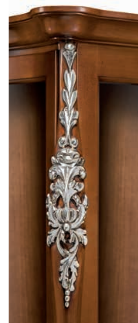
Noce + foglia argento