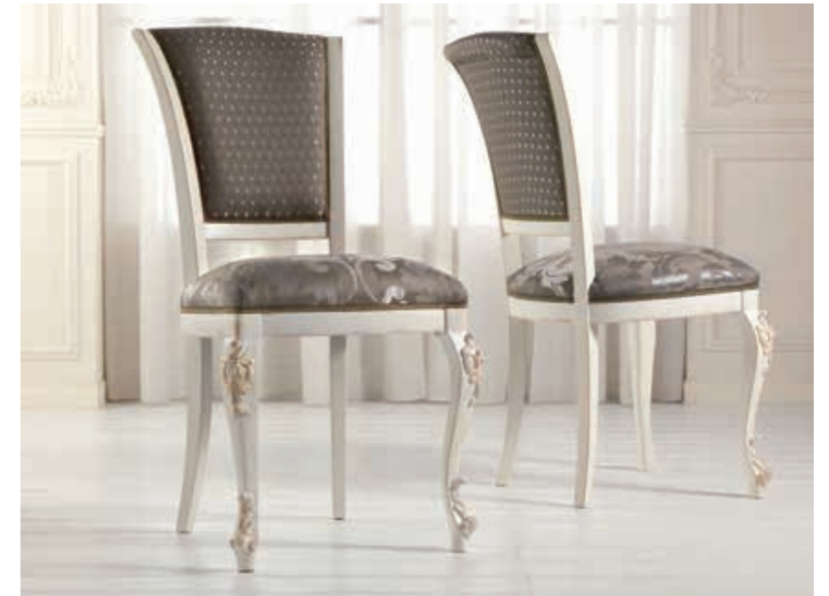
Art. 1004T - Sedia / Chair - 54 x 59 x 101H - tessuto / fabric "Rubino"