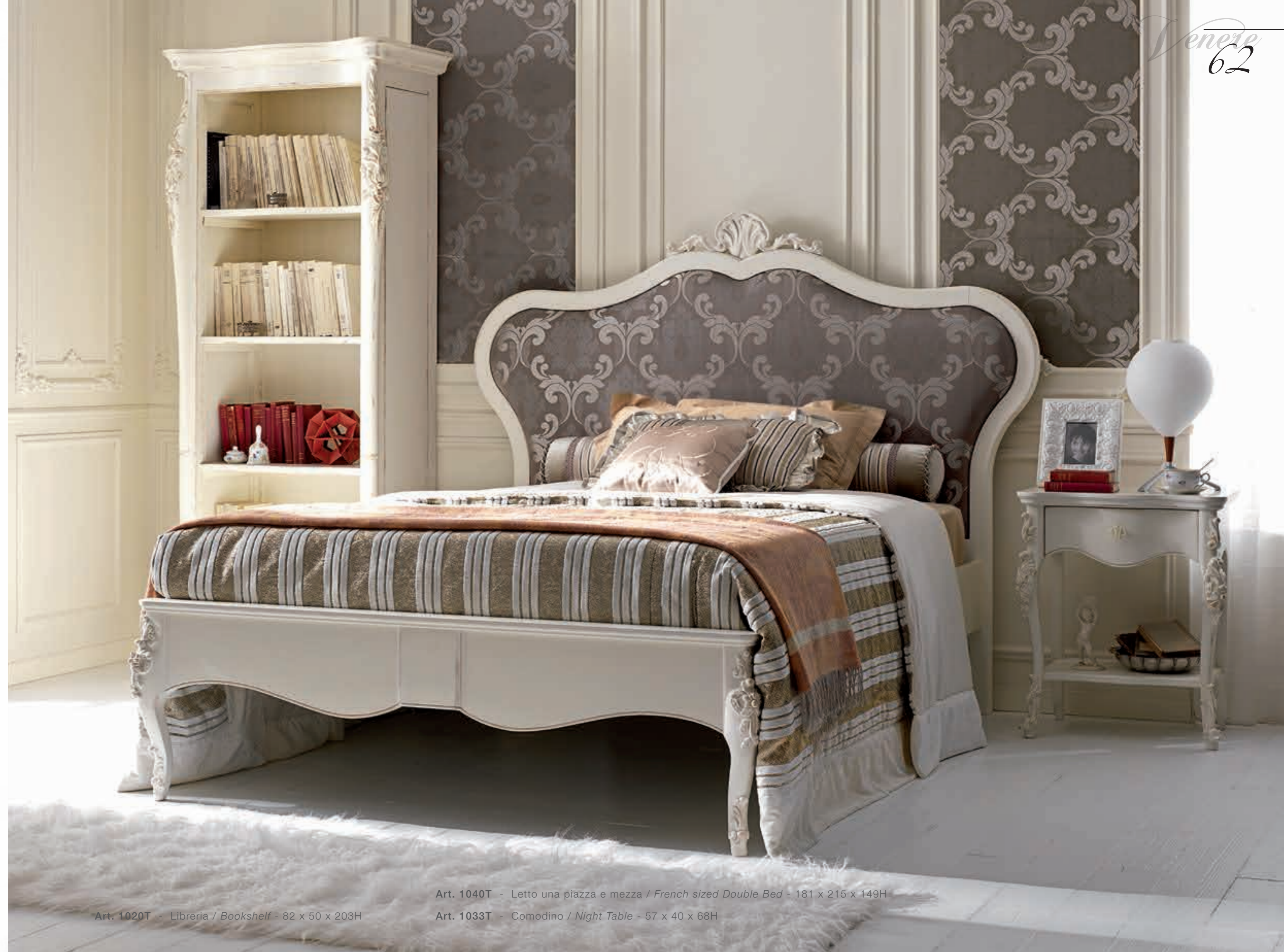
Art. 1020T - Libreria / Bookshelf - 82 x 50 x 203H

Upholstered headboard and decapè finish define a style of furniture that recalls the ancient with understated elegance, in a warm and relaxing atmosphere that makes you feel protected in a tender embrace. The French sized double bed, is more comfortable for a adult or teenager compared to a single bed, and less demanding than a normal double bed.