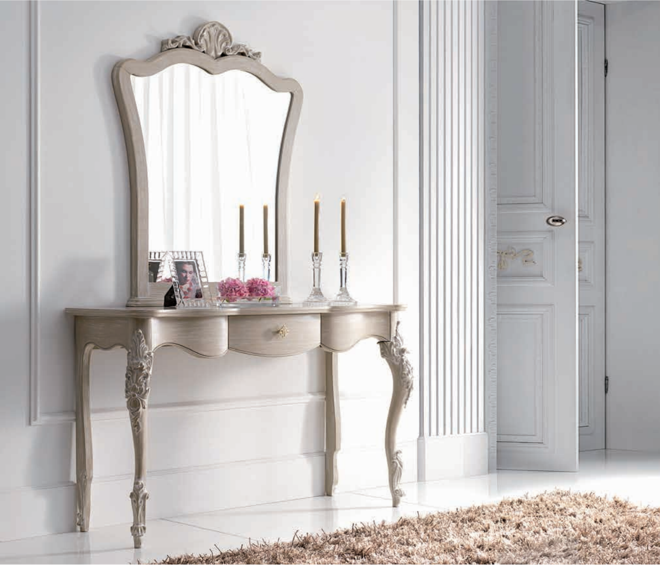
Art. 1014T - Consolle / Console - 142 x 46 x 83H