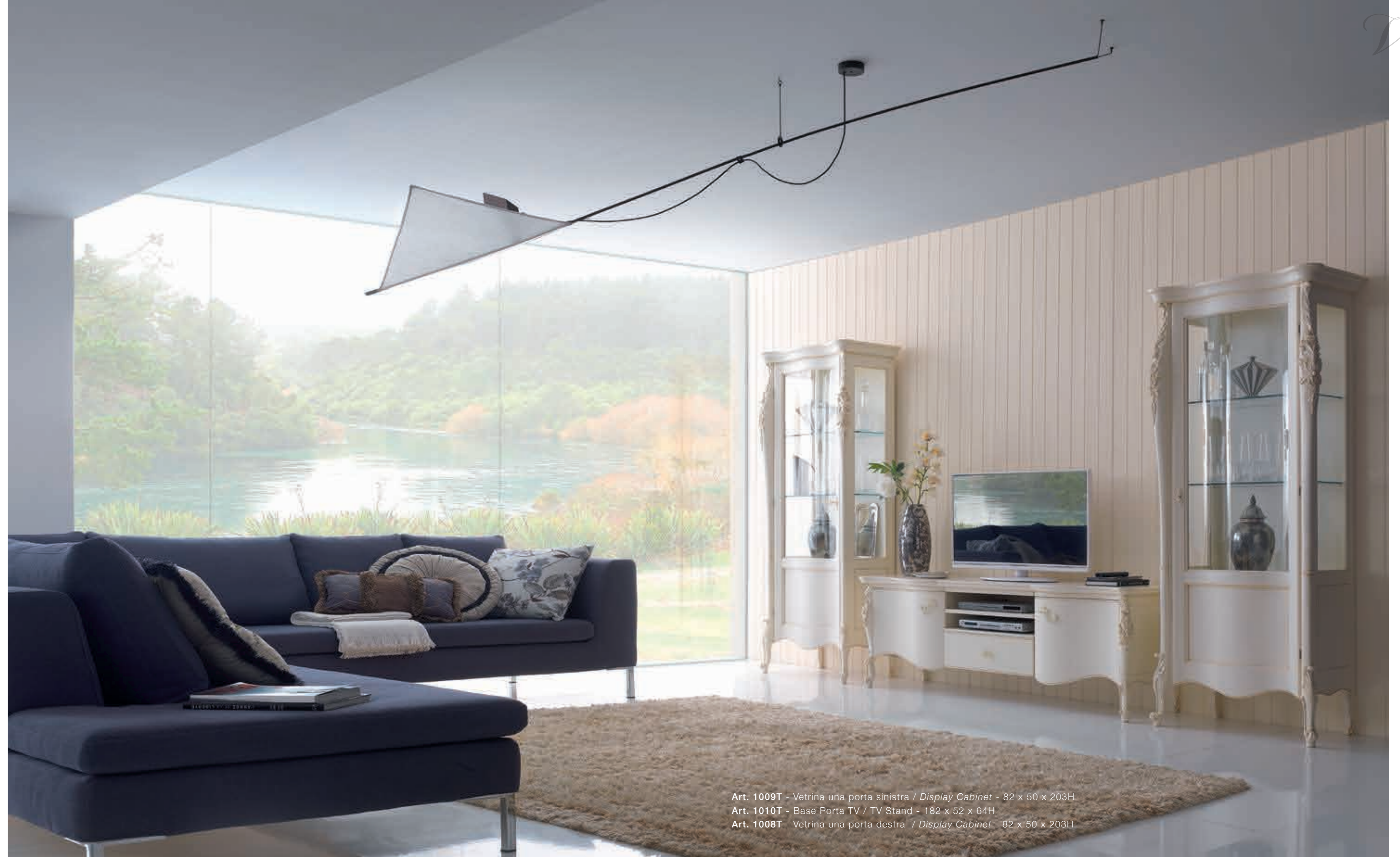
Art. 1009T - Vetrina una porta sinistra / Display Cabinet - 82 x 50 x 203H Art. 1010T - Base Porta TV / TV Stand - 182 x 52 x 64H Art. 1008T - Vetrina una porta destra / Display Cabinet - 82 x 50 x 203H