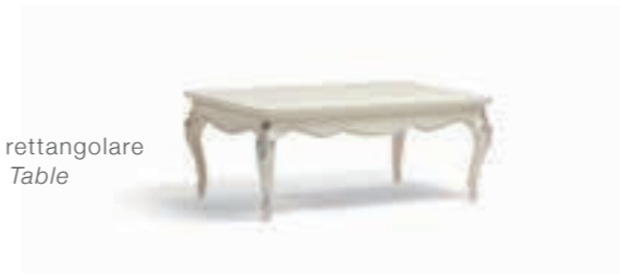
Art. 1022T Tavolino da salotto rettangolare Rectangular Coffee Table 120 x 80 x 48H