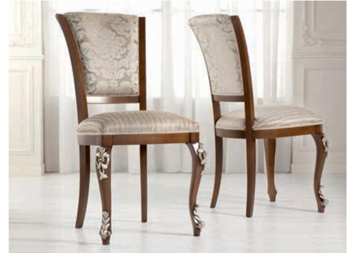
Art. 1004T - Sedia / Chair - 54 x 59 x 101H - tessuto / fabric "Vienna"