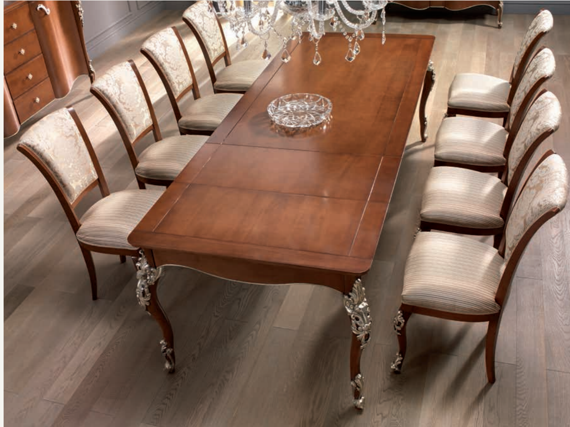
Art. 1003T - Tavolo con due allunghe cm.39 / Table two extensions cm.39 - 201 x 101 x 81H Art. 1004T - Sedia/ Chair - 54 x 59 x 101H - tessuto / fabric "Vienna"