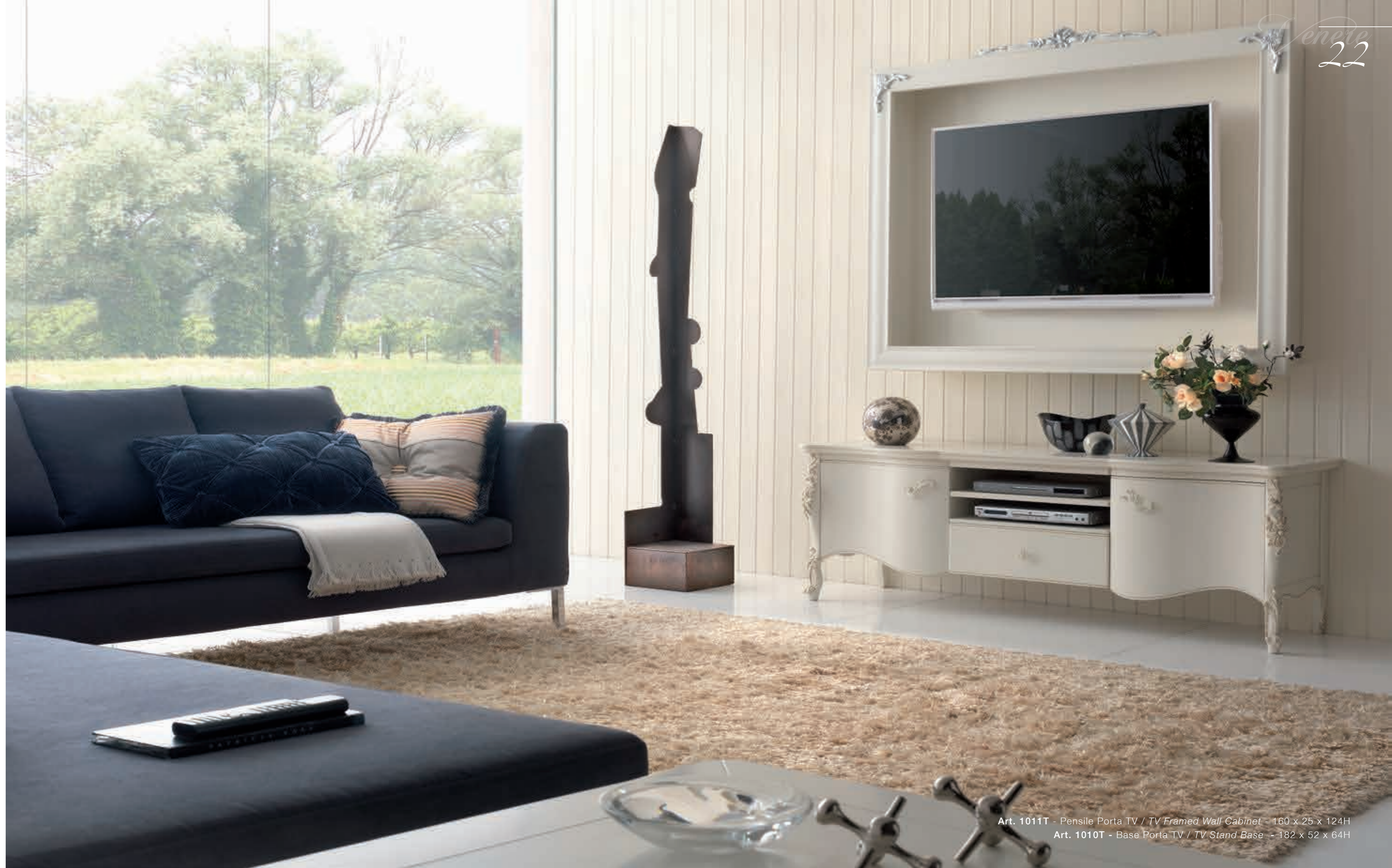
Art. 1011T - Pensile Porta TV / TV Framed Wall Cabinet - 160 x 25 x 124H Art. 1010T - Base Porta TV / TV Stand Base - 182 x 52 x 64H