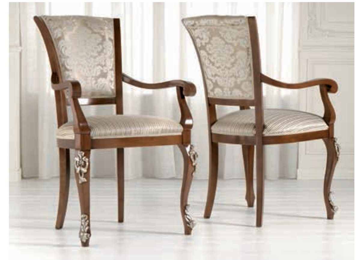
Art. 1005T - Sedia capotavola / Armchair - 64 x 62 x 101H - tessuto / fabric "Vienna"