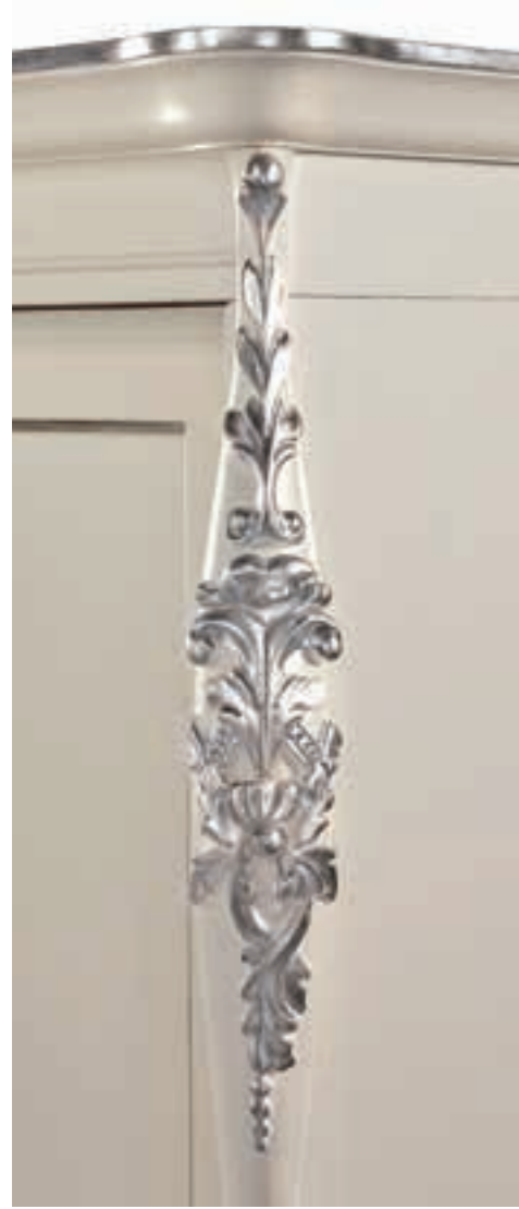
Burro + foglia argento