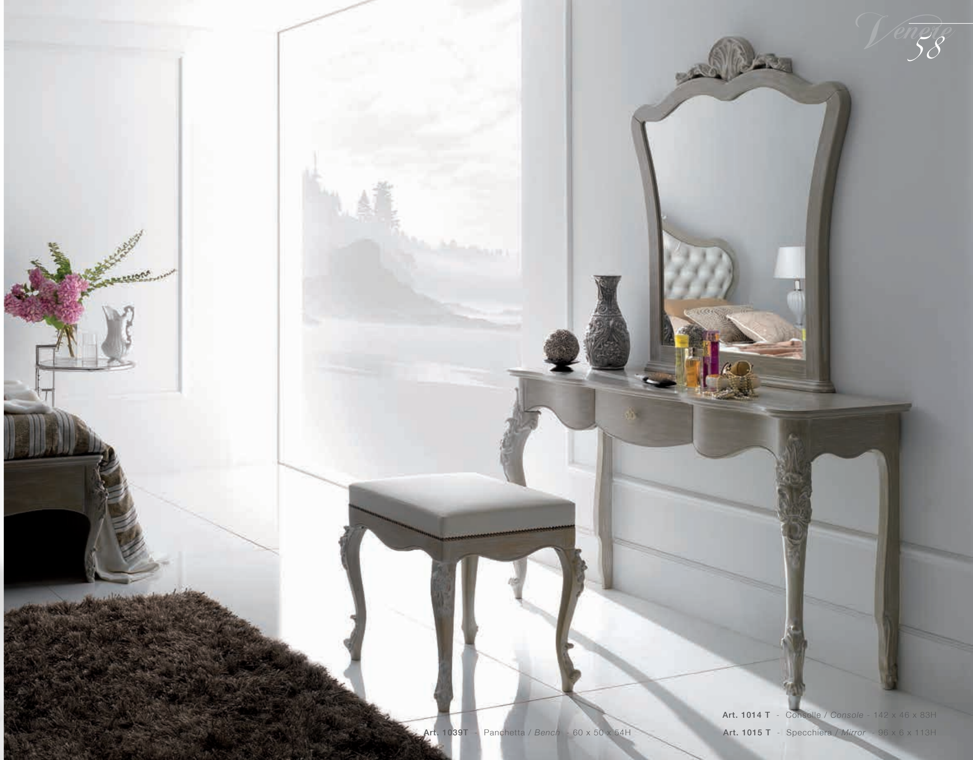
Art. 1039T - Panchetta / Bench - 60 x 50 x 54H