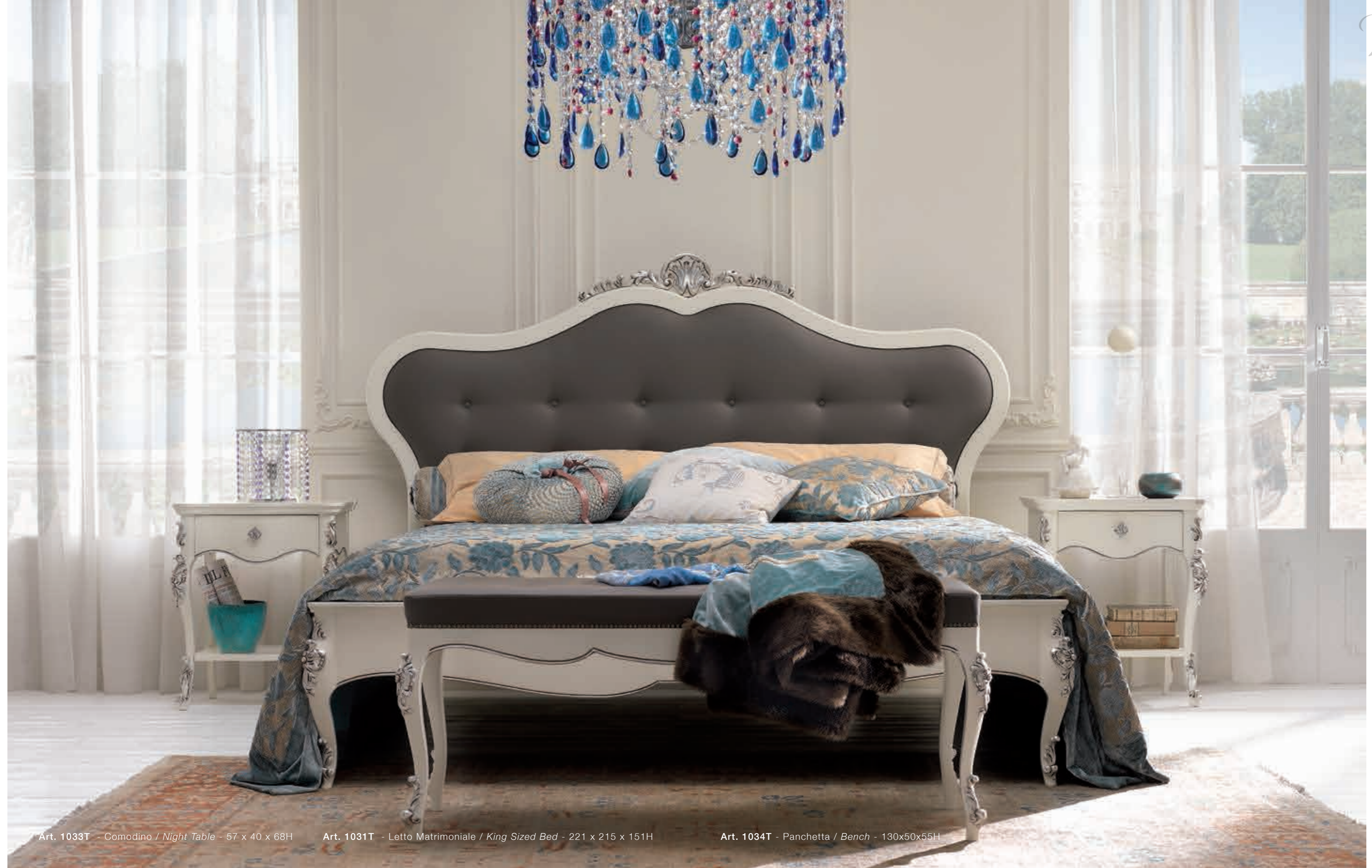
Art. 1033T - Comodino / Night Table - 57 x 40 x 68H