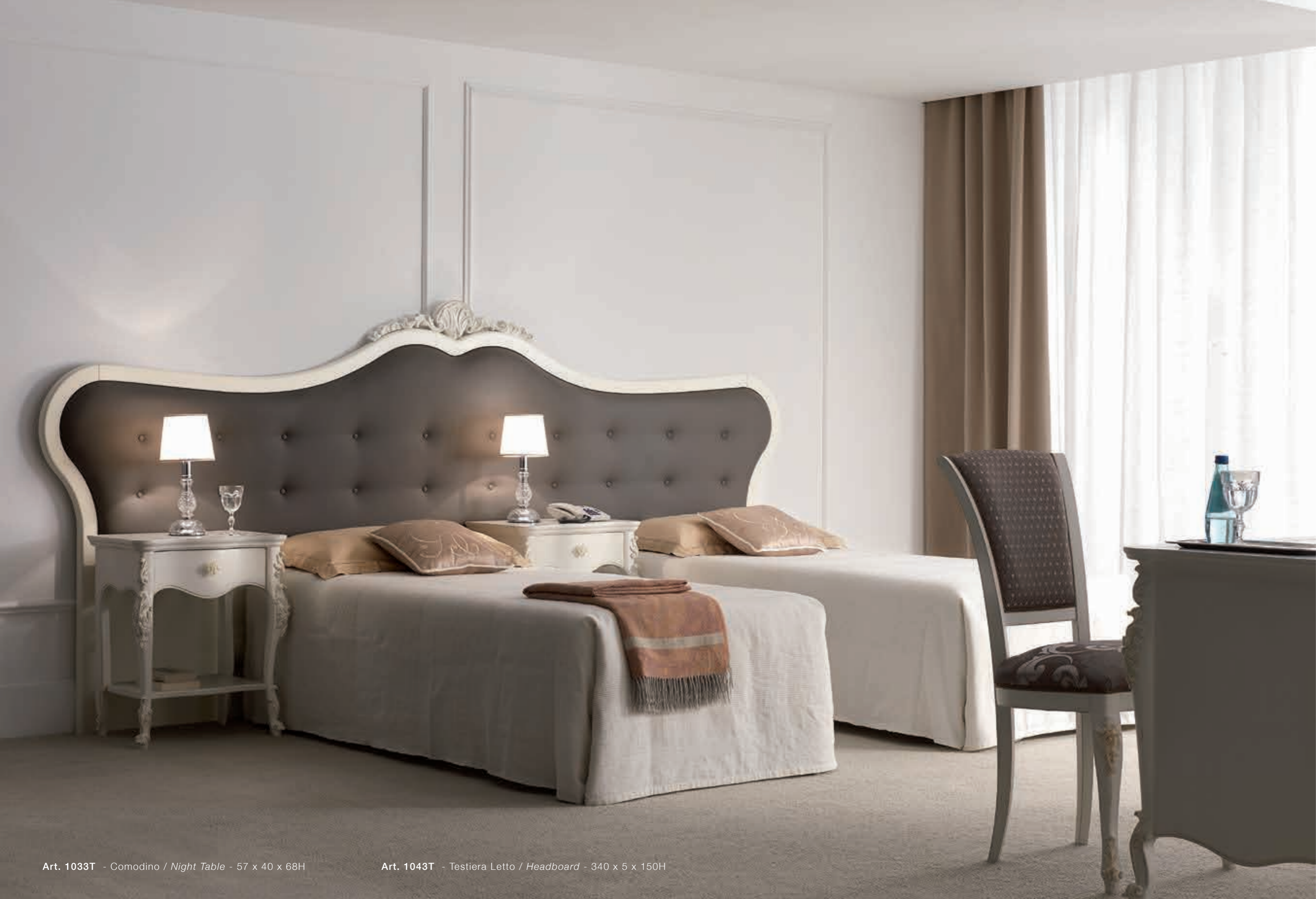
Art. 1033T - Comodino / Night Table - 57 x 40 x 68H