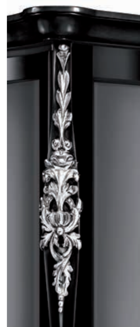
Nero + foglia argento