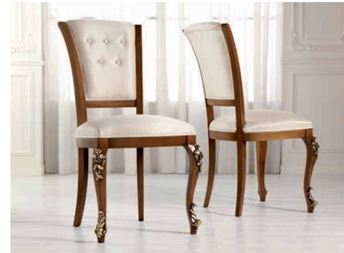
Art. 1004T - Sedia / Chair - 54x59x101H - tessuto / fabric "Siria"