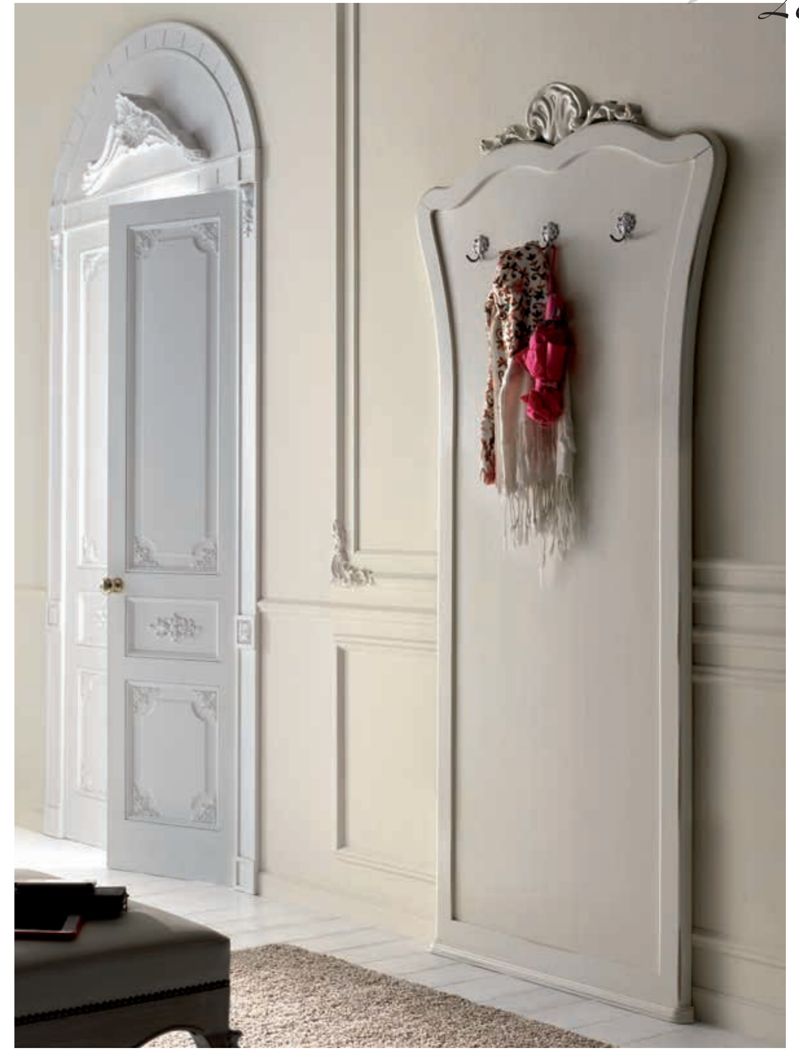
Art. 1016T - Pannello da ingresso / Clothes Hanger Panel - 96 x 6 x 207H