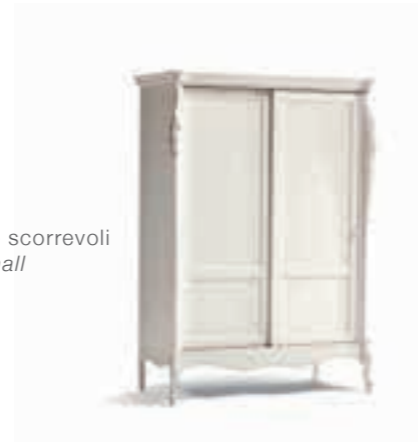
Art. 1042T Armadietto 2 ante scorrevoli Sliding 2-Door small Wardrobe 148 x 67 x 204H