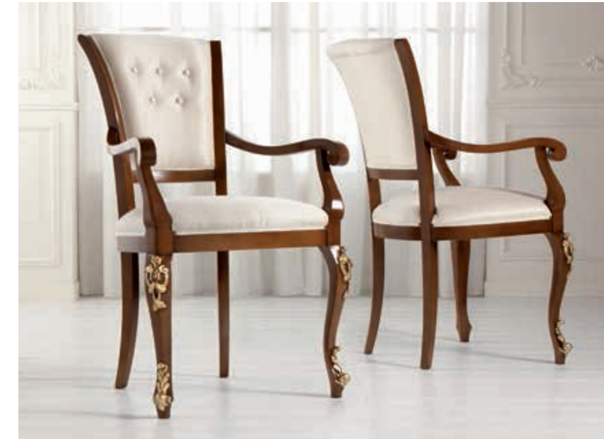
Art. 1005T - Sedia Capotavola / Armchair - 64x62x101H - tessuto/fabric "Siria"