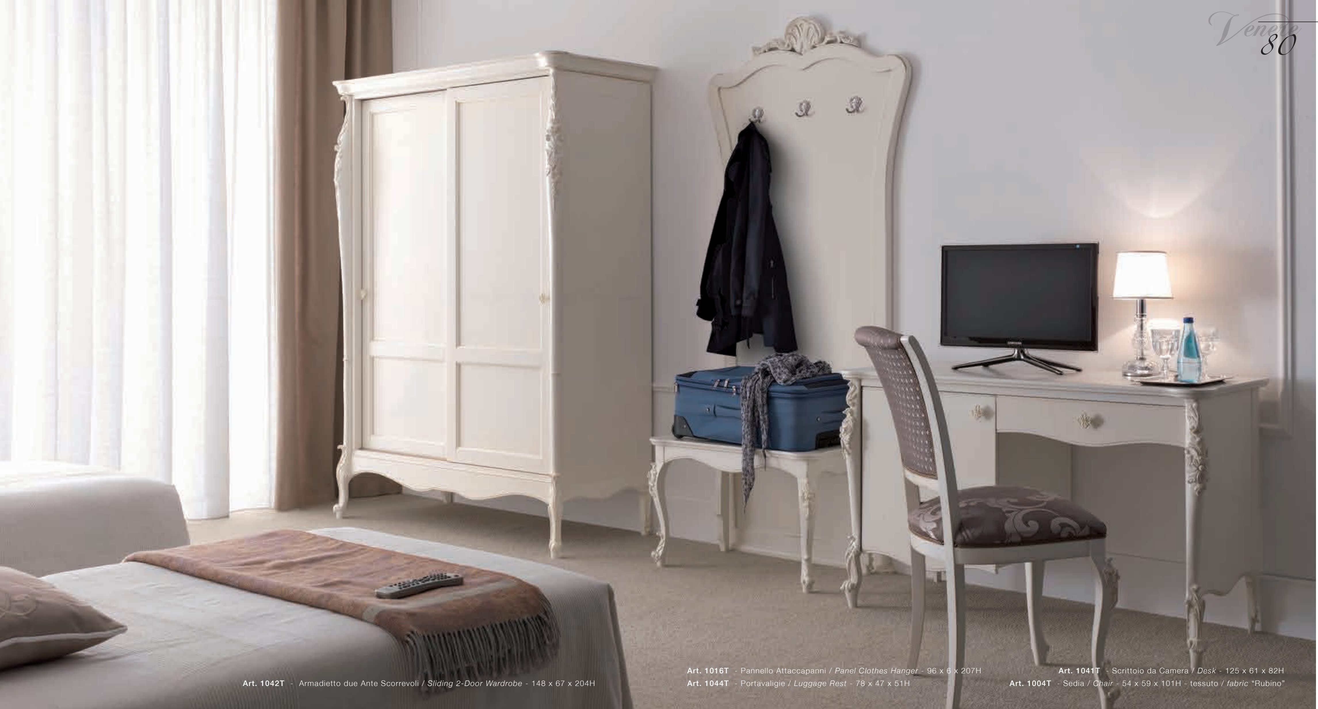
Art. 1042T - Armadietto due Ante Scorrevoli / Sliding 2-Door Wardrobe - 148 x 67 x 204H