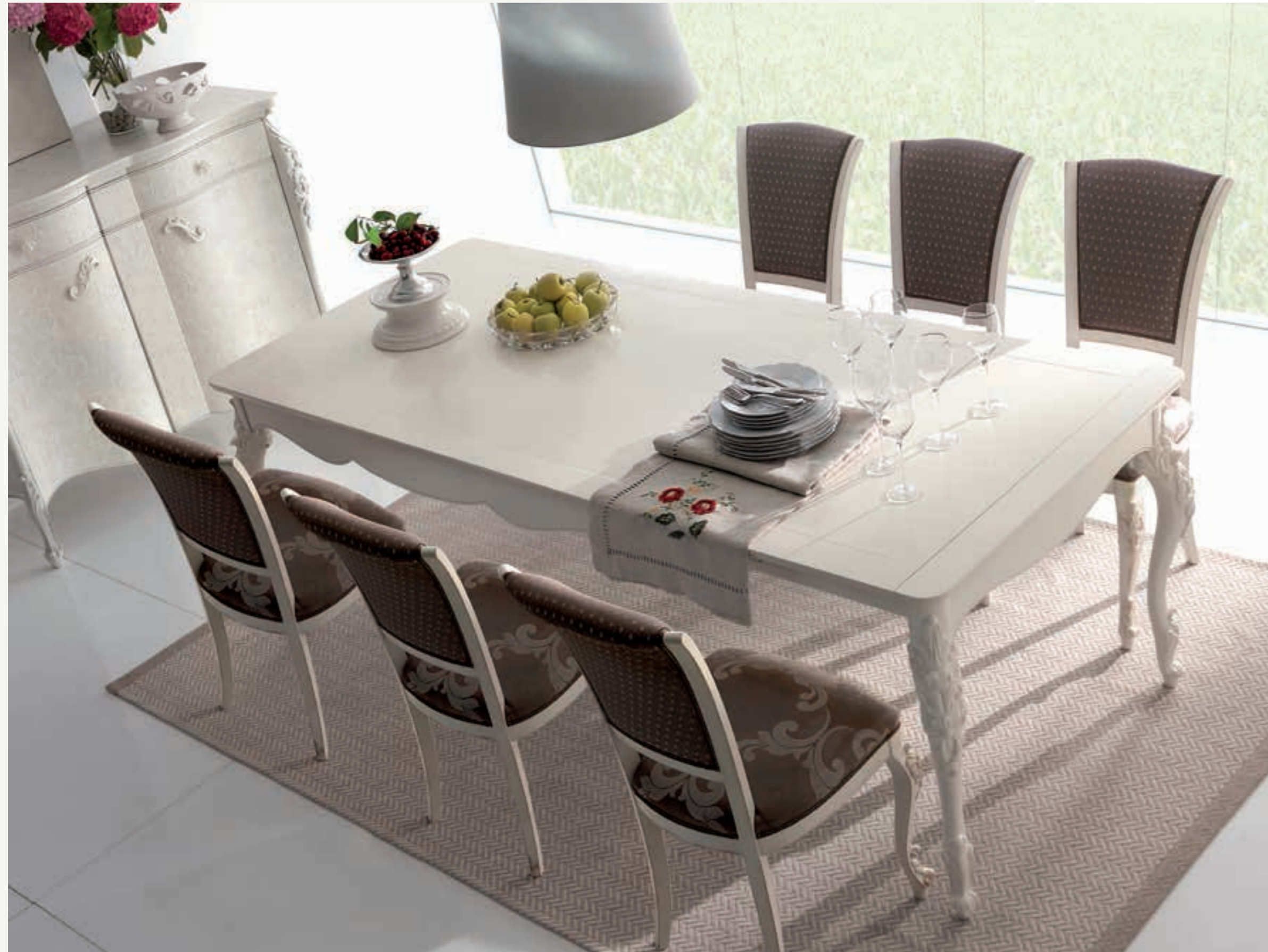
Art. 1007T - Tavolo due allunghe cm.39 / Table 2 extensions cm.39 - 161 x 101 x 81H