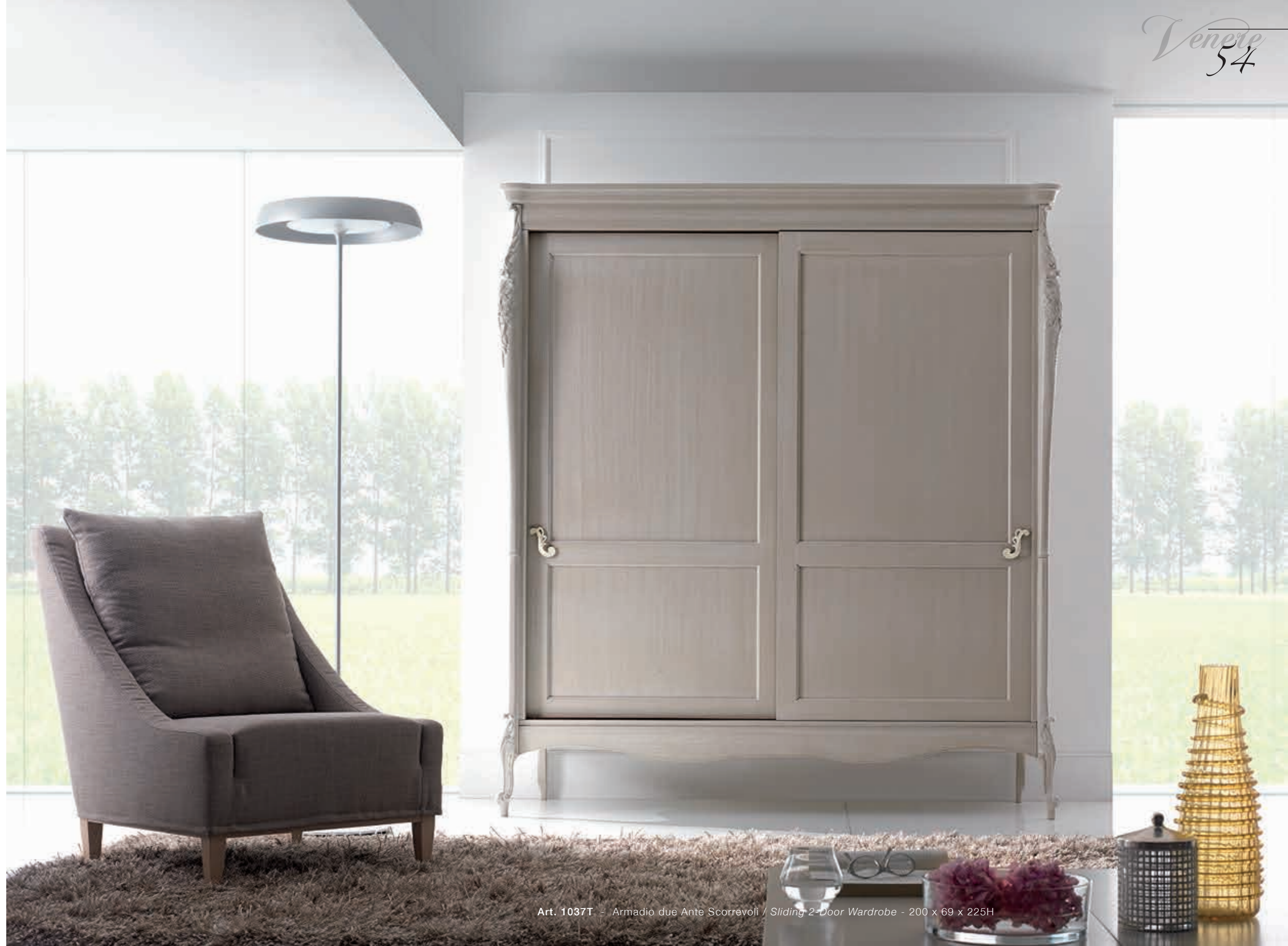
Art. 1037T - Armadio due Ante Scorrevoli / Sliding 2-Door Wardrobe - 200 x 69 x 225H